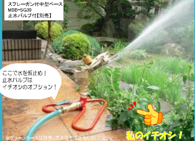
※グリーンホースは別売。高水圧では止水しないこと。