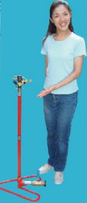
スプレーガン付中型ベース MBB-SG30 止水バルブ付【別売】