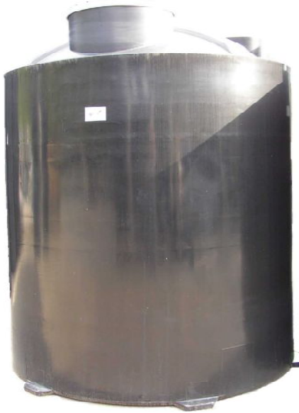
ブラックタンクBT-4000 (容量4t)