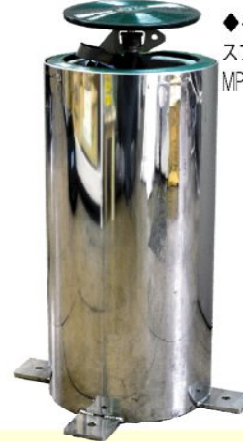
◆ベンチ式 スプリンクラー MP-LVZE22型