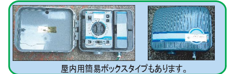
屋内用簡易ボックスタイプもあります。

ボックス形状は、①屋外壁掛②屋内壁掛③屋外スタンド④屋外自立の4つのタイプが選べます。カギ付きなのでイタズラの心配がありません。