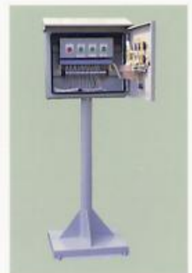
屋外スタンド型3チャンネル