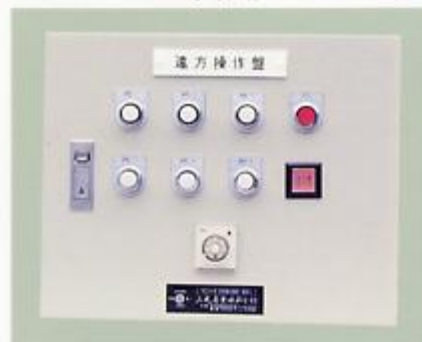
屋内壁掛型、6チャンネル