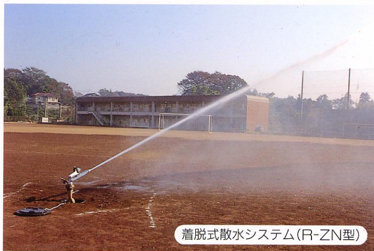
着脱式散水システム(R-ZN型)

【御注意】 平成8年5月1日よりZN23型は総て改良型になりました。改良型の本体の色はシルバー(銀色)に変わりました。旧型の色はレッド(赤色)です。