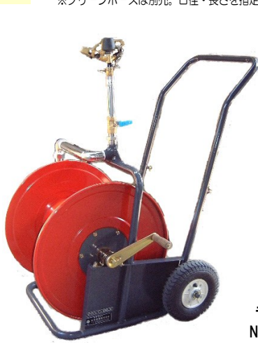
ライトレイン大型二輪散水車 ZB-2WL