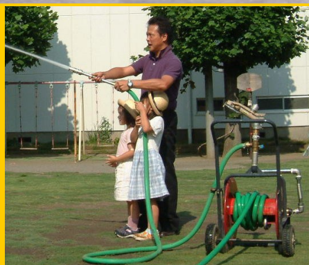
散水ノズル(ハンドスプレー)とスプレーガン(スプリンクラー)の2方式散水が可能、 NSG30-2WL-V型 もあります!