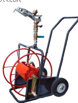
ライトレイン中型二輪散水車 NSG30-2WM 型 ・ SG25-2WM 型 ※写真は NSG30-2WM