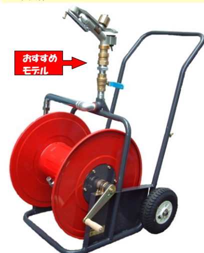
ライトレイン大型二輪散水車 NSG30-2WL 型 ・ SG25-2WL 型 ※写真は NSG30-2WL