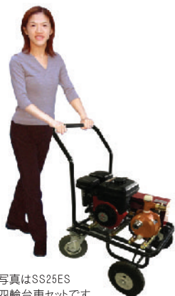
※写真はSS25ES 四輪台車セットです。