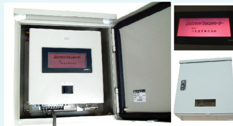
※標準は2チャンネル仕様