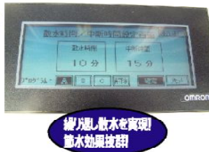
繰り返し散水を實現 節水効果抜群

機能① 業界初！屋根冷却散水に最適 屋根冷却散水の場合、1時間に1回10分間程度の散水を繰り返す必要性があります。中断時間をセットし、散水→中断→散水→・・・をご希望の時間内に繰り返す機能を搭載しました。節水・節電効果が得られます。ハウス栽培の作物養生でも使用可能です。